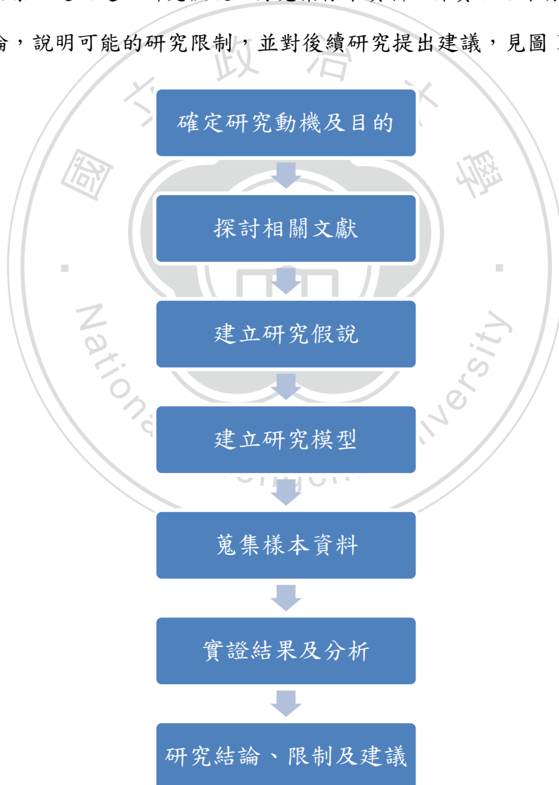
圖 1-1 研究流程

本研究首先說明管理階層之盈餘預測以及財務分析師盈餘預測修正之重要性，並針對財務會計準則公報第 34 號之發布，探討其對於盈餘預測之影響程度，藉以形成研究動機；接著探討國內外相關文獻，包括：財務會計準則公報第 34 號對財務報表之影響、與管理當局盈餘預測攸關之文獻、影響財務分析師盈餘預測修正之因素，進而建立研究假說；再蒐集樣本資料，作實證結果分析，最後做出研究結論，說明可能的研究限制，並對後續研究提出建議，見圖 1-1。