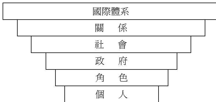
圖 1-1：分析的六個層次

資料來源：Bruce Russett, Harvey Starr,《國際政治》(World Politics)，張明澍譯（台北：五南，1995年3月），頁14。