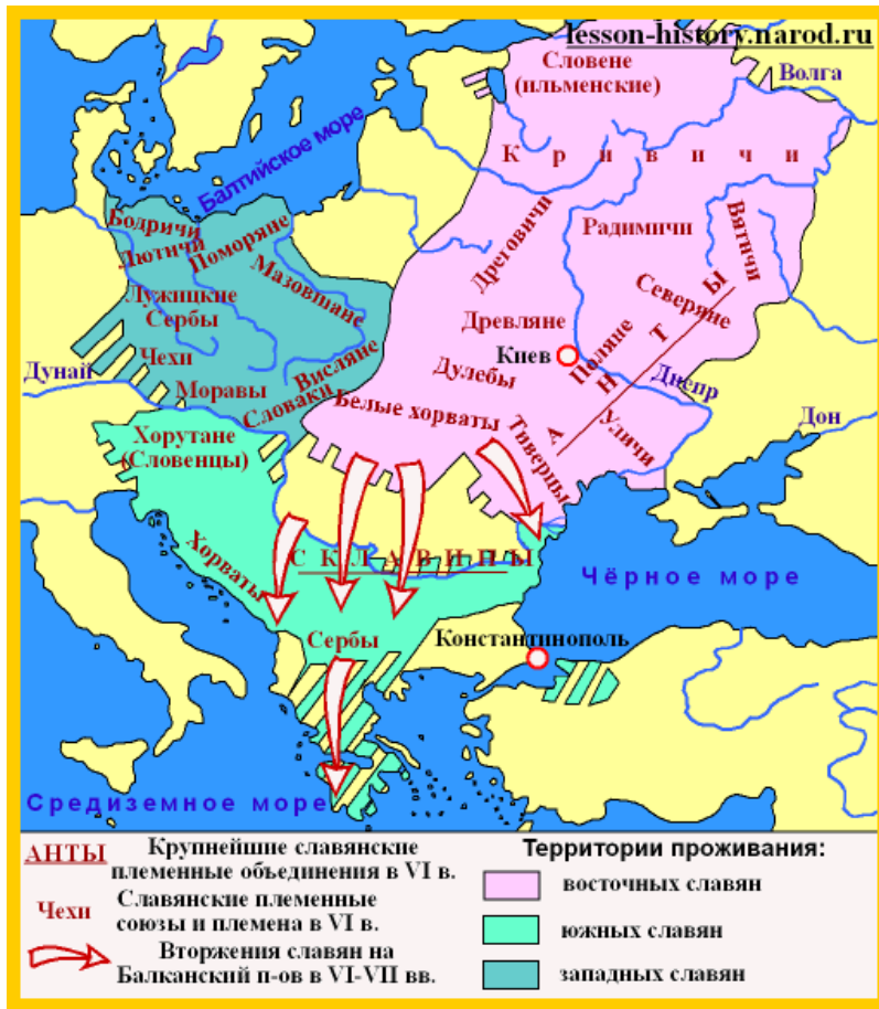
圖一 東斯拉夫人、西斯拉夫人、南斯拉夫人分布圖